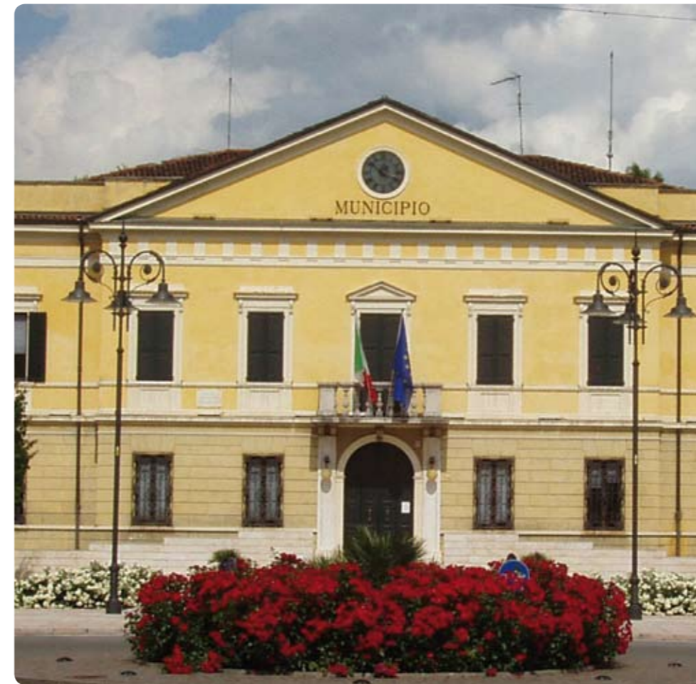
La sede del Municipio di Pegognaga, che beneficerà dell'energia prodotta dall'impianto assegnato all'Ente, realizzato a Popoli.

Le azioni che il Comune di Pegognaga ha attuato per ridurre le emissioni di CO2